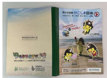
ボランティア協賛の竹紙ノート