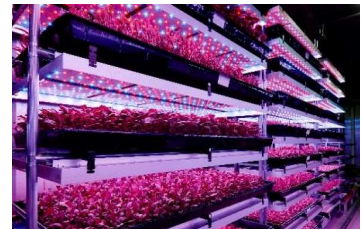
コンテナ内部の栽培棚

システムをネットワークに接続し、最新のソフトへの自動アップデートや栽培レシピの追加、遠隔監視、遠隔サポートなど、導入後も常に最新の栽培技術で運用できます。