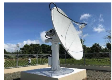
3.5mパラボラアンテナ追尾装置

現在は人工衛星の自動追尾だけでなく、ロケットなどの移動体をリアルタイムに自動追尾ができるシステム開発も進めています。