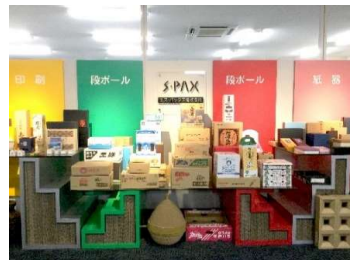
当社ショールーム

長年に渡る包装資材の専門企業として蓄積された実績、豊富な専門知識を発揮し、安心の品質で製品をお届けいたします。また、デザイングループによるパッケージ提案から、緻密な設計、自社工場での一貫製造まで、スピーディーな対応が当社の強みです。お客様のビジネスやターゲット等をきちんと理解し、マーケットのトレンドや最新デザイン等、常に情報を収集し、パッケージデザインや形状に反映させることで商品の付加価値を更に高め「売れるモノづくり」「環境に優しいモノづくり」を追求しています。