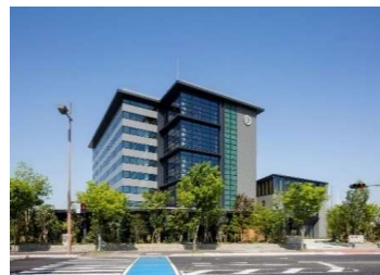
松尾建設株式会社 本店

山佐木材は、林野庁委託事業にて各種確認試験を実施、2016年5月、国交省より、CLT床2時間耐火構造の認定を取得しました。これにより耐火構造が求められる非住宅・中大規模建物の床に木造、鉄骨を問わずCLTを使用することが可能となりました。山佐木材は「超高層ビルに木材を使用する研究会」の設立に関わり、事務局、会員として「鋼構造オフィスビル床のCLT化」というテーマで現在も研究開発を推し進めております。松尾建設(株)様は、地球環境改善には欠かせない低炭素社会実現の一役を担う試みとして、5階建ての自社ビルの床に認定後初の2時間耐火CLT210mm厚を使用され、環境保護に積極的な企業としての取り組みを実施されました。