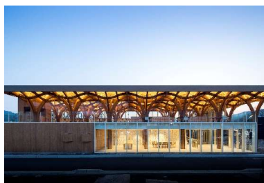
施工例:由布市ツリストインフォメーションセンター