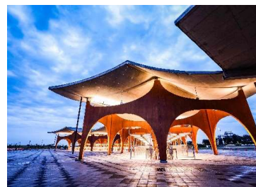
施工例:新竹漁港観光拠点施設