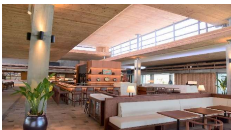
施工例:みやこ下地島空港 ターミナル