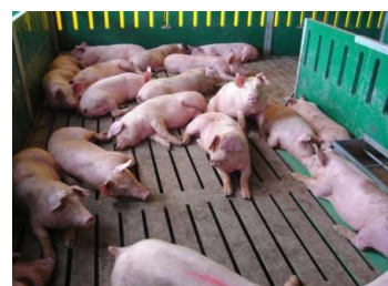
焼酎粕を与えられている豚たち

当社では、焼酎造りの過程で出る「焼酎粕」が一日に最大約150トン排出されます。以前は海洋投入により焼酎粕を処分していましたが、平成19年(2007年)より海洋投入が禁止されました。これにより各社様々な方法で「焼酎粕」を処分しており、その一つには焼却処分などがあります。当社では地元畜産企業の協力を得て、豚の飼料として有効利用しています。豚は液餌をより好むことから成育もよく、芋のポリフェノールとビタミンEが焼酎粕にも含まれており、豚の肉質の向上にもつながりました。いままで活用手段のなかった「焼酎粕」ですが、豚の飼料として利用する新しい方法が生まれました。