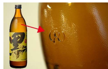
リユース瓶R900のマーク

また、紙パック商品においても、以前は透明ビニールフィルムの包装をしていましたが、輸送中などに破れやすく、また、使用時にはごみになるため平成21年(2009年)よりビニール包装を廃止しています。省資源を考え、プラスチックの使用を抑える努力を行ってきております。大口酒造は、このように容器包装を適宜見直し、環境に負担の少ない焼酎造りに努めています。