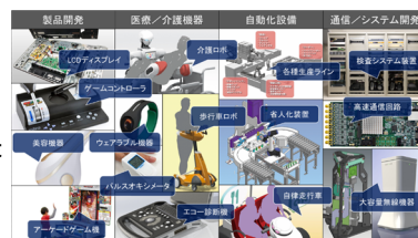
幅広い分野における設計開発

あらゆる分野(食品産業、医療、インフラ、宇宙航空機器、半導体デバイス、検査装置、計測機器等)の幅広い設計経験とモノ作りの実績を活かした設計開発事業を受託しています。昨今の人手不足に貢献する産業用ロボットを軸にハンドローダー・アンローダー・ワークセット・制御盤・ソフトウェアまで含めたシステム一式の導入支援から構築までロボットメーカーでは出来ない顧客要求に寄り添った自動化ソリューションを提案出来ます。