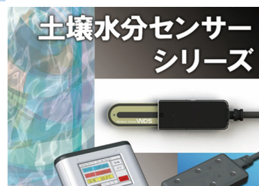
自社開発製品 水分センサー