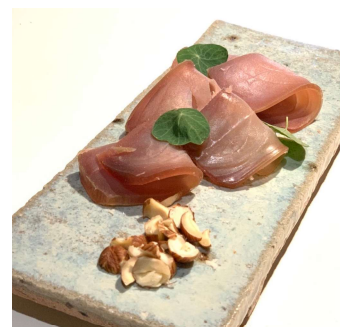
串木野まぐろブレザオラ