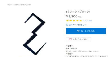
E-コマースにて自社ブランド販売