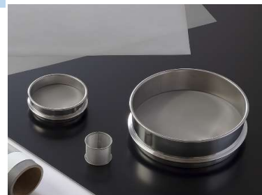
篩(ふるい)フィルター用メッシュ

長年培った技術力で篩(ふるい)・フィルター用金属メッシュを生産しています。高抗張力の金属メッシュは耐摩耗性、ふるい効率に優れており、幅広いラインナップがあります。篩用途において最も目の粗いメッシュで62mesh(目開き250 \mu m)、最も目の細かいメッシュで977mesh(目開き13 \mu m)となり、特に細かいメッシュの製造を得意としております。また、フィルター用途においては、参考濾過精度2~3 \mu mに対応した畳織り4,860メッシュも製造しており、耐食性が求められる環境におけるフィルターに使用されています。