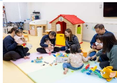
アサダキッズ(社内託児所)

また、事務所棟内には休憩時間にリラックスし休める様にスタイリッシュな食堂空間を完備しており、一人でゆったりと休めるラウンジチェアは休憩時間に仮眠をとることができます。その他にも、リフレッシュコーナーとして100円で購入可能なカップ麺、サラダ等も設置されています。